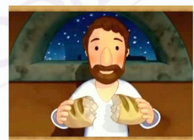
Isusova posljednja večera i smrt