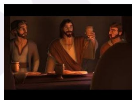
Super knjiga sezona 1 epizoda 10