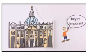
YouTube - Oznake Crkve