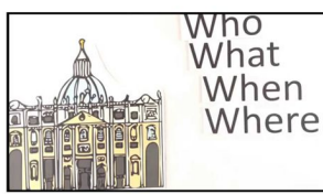
YouTube - Crkva